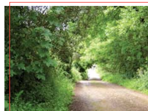
Acceso al Paraje Natural

Dentro de la Finca Dehesa Navalacedra, de propiedad pública, se pueden realizar visitas guiadas, previamente concertadas, para disfrutar del maravilloso entorno paisajístico del que goza, y ver la fauna que habita en ella, como: ciervos, jabalíes, gamos, buitres leonados y águilas imperiales.