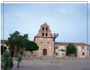
Iglesia de la Purísima Concepción