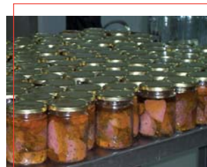
Conservas de carne de monte