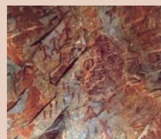
Arte Rupestre Esquemático

Distintos grupos de representaciones humanas, escenas de caza, animales y simbólicas, pintados en una veintena de sitios, localizadas en farrallones rocosos y abrigos de la zona, destacando: La Cimbarra, Cueva de la Mina, Garganta de la Hoz, Cimbarillo del Prado de Reches, Monuera, Desesperada y la Tabla de Pochico, entre otros. Estos yacimientos son los más importantes de Andalucía, y pueden considerarse como verdaderos museos al aire libre.