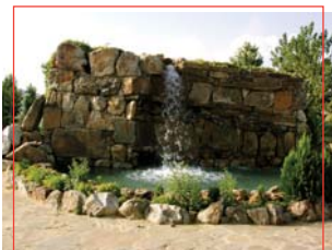
Alegoría de la Cimbarra