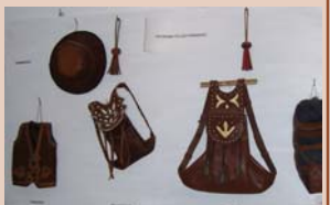
Artesanía del cuero

Es destacable la artesanía del cuero, debido a la necesidad de los habitantes de fabricarse sus propios útiles de uso cotidiano, delanteras para caballerías, fundas para navajas y cuchillos, morrales para transporte de la caza, etc., todo ello primorosamente trabajado a mano, así como la artesanía en cuerda, bastones, llaveros de asta de ciervos, costura y artesanía en general.