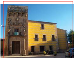
Palacio de los Niños de D. Gome

Posee, entre otros tesoros destacados, el cuadro La Oración en el Huerto de los Olivos de Domenico Theotocopoulos, «El Greco», óleo sobre lienzo fechado entre 1605 y 1610, una de las escasas obras pictóricas existentes en Andalucía de este magnífico artista, así como el cuadro de La Inmaculada , obra de Giuseppe Cessari, también conocido como «El Caballero Alpino», o un manuscrito de San Juan de la Cruz.