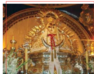
Stma. Virgen de la Cabeza

Finalizada por los almohades en el siglo XII, tenía forma trapezoidal y medía 1.750 m., con 7 puertas y 48 torreones macizos en su parte baja y una reducida estancia arriba, y 4 grandes torres ochavadas. Delante de la muralla había un antemuro o barrera, terraplenes y fosos. Se construyó con calicanto y a veces con cadenas de sillería o ladrillo, deteriorándose fácilmente. Actualmente destacan dos antiguas torres: el Torreón de Tavira y el Torreón de la Fuente Sorda, forrados con sillería posteriormente.