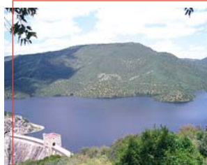
Embalse del río Jándula

Mantiene labores artesanales de otro tiempo, destacando la alfarería (silbato de barro y de caballito), azulejería y cerámica (jarras grutesca y del estudiante), la albardonería y talabartería (creación de aparejos para arreos para montar y equipar equinos), la piel y la sastrería , así como la forja, la artesanía de la anea (para confeccionar asientos de sillas y sillones, con esparto y mimbre) o la fabricación de guitarras . La explotación cinegética y ganadera ha posibilitado la taxidermia y la cera .