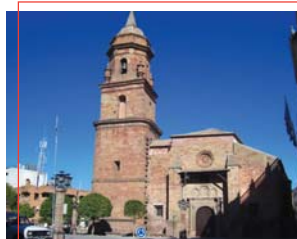
Iglesia de San Miguel