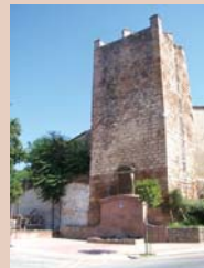
Torreón de la Fuente Sorda

Finalizada por los almohades en el siglo XII, tenía forma trapezoidal y medía 1.750 m., con 7 puertas y 48 torreones macizos en su parte baja y una reducida estancia arriba, y 4 grandes torres ochavadas. Delante de la muralla había un antemuro o barrera, terraplenes y fosos. Se construyó con calicanto y a veces con cadenas de sillería o ladrillo, deteriorándose fácilmente. Actualmente destacan dos antiguas torres: el Torreón de Tavira y el Torreón de la Fuente Sorda, forrados con sillería posteriormente.