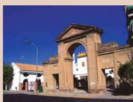
Arco de Carlos III

El Puente Viejo, tradicionalmente conocido como romano; la Torre del Reloj (S. XV), mirador con un fabuloso Escudo Imperial de los linajes de Carlos V e Isabel de Portugal, y un reloj de sol labrado en piedra; la Fuente Barroca, de 1739, obra de José Gallejo; la Hornacina del Cuadro de la Virgen, de 1610 obra de Rafael Pérez de Ortega y reedificada en 1856 para albergar un cuadro de la Virgen de la Cabeza; o el Arco de Carlos III, hito conmemorativo realizado en ladrillo en 1786, antigua puerta del Camino Real que unía Madrid con Cádiz, conocido como el Arco de Capuchinos.