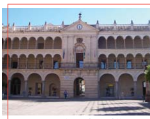
Ayuntamiento de Andújar

Oficina Municipal de Turismo Torre del Reloj – Pza. Santa María, s/n C.P.: 23740 Tlf.: 953 50 49 59 turismo@andujar.es www.andujar.es