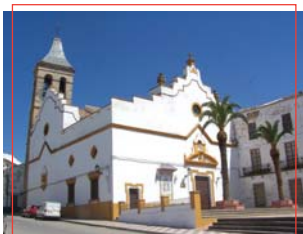
Iglesia de San Martín