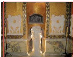
Cripta del Barón de Velasco