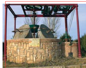
Monumento al aceite