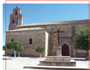
Iglesia de Santa María

La Quema de Daciano, delegado de Roma que martirizó a los Santos con una cruenta tortura y posterior decapitación. Se quema a un muñeco vestido de romano en la Plaza de Santa María.