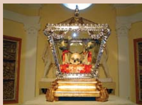
Urna de las Reliquias

El cardenal Moscoso fue el impulsor del descubrimiento y glorificación de las reliquias halladas en 1628, entre ellas las de Bonoso y Maximiano, hermanos naturales de la vecina Ilturgi romana, que en el 308 se entregaron al martirio, siendo torturados y decapitados, por reafirmarse cristianos durante la persecución de Diocleciano y Maximiano, siendo Prefecto en la Península Plubio Daciano. El Santuario de las Reliquias, en la Plaza de Santa María, levantado en el S. XVII, actualmente da cabida al “Museo de los Santos”, en el que se exhiben las reliquias y parte del patrimonio de la cofradía de los Santos.