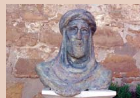
Busto de Al-hamar

Mohamed ben Yusuf ben Nasr Al-hamar, fundador del reino de Granada y de la dinastía nazarí, nace en Arjona en 1195. Tras rebelarse en 1232 contra el débil rey Aben-Hud, Alhamar se proclama emir de Al-Andalus, y extiende su autoridad a Porcuna, Jaén, Guadix y Baza. En 1237 entra en Granada e inicia la construcción de la fortaleza de la Alhambra, edificando las primeras dependencias sobre una antigua fortaleza denominada Al-Hamra.