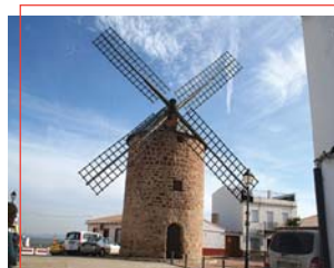
Molino de Viento

Rollo Bañuelo: Hecho de carne picada con pan rallado y rellena de jamón, tocino y huevo duro que se enrolla y se fríe para cocerlo en agua con vino.