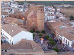
Iglesia de San Mateo y entorno

Esta Iglesia, que da cobijo a la Patrona, la Virgen de la Encina, alberga en su interior un grandioso retablo mayor de estilo compuesto y paramento de colosales proporciones, obra de Francisco Palma Burgos. También destacan el púlpito, el coro y la pila bautismal, de mediados del S. XVIII. Pero su elemento más importante es el Sagrario , una de las joyas del arte sacro de la provincia del S. XVII, construido en madera de ébano, marfil, plata y concha de carey.