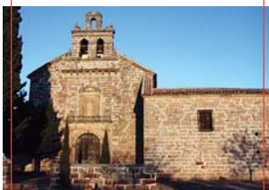
Ermita de la Virgen de la Encina

Iglesia de San Mateo (S. XV-XVIII): Nave principal y portada lateral del gótico, y la principal manierista, de 1576. Más tardías son la torre renacentista y fachada. El crucero neoclásico con pechinas barrocas es de 1732.