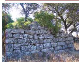
Restos de las Salas Galiardas