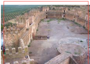
Interior del Castillo