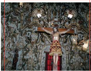
Camarín del Cristo del Llano