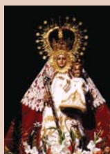
Virgen de la Encina

Un 9 de mayo de 1225, un labriego que araba cerca de un encinar próximo a la Cuesta de los Santos vio la imagen de una Virgen, subida en una encina, que le