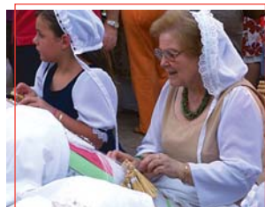
Encajera de bolillos

solicitó la construcción de un santuario para su culto. Este árbol no sólo dio nombre a la advocación mariana, sino que daba aceite para los más necesitados. Así cuenta la voz popular como nació la devoción a la Patrona de Baños de la Encina.