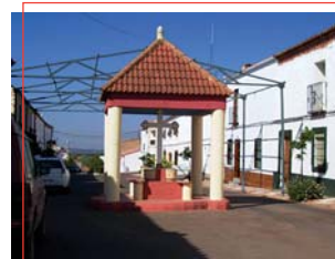
Cruz en La Mesa