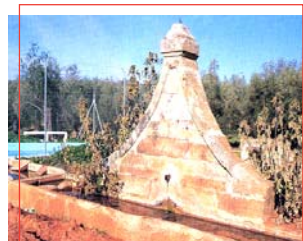
Fuente del Siglo XVIII

Flores de Semana Santa, que sirven de postre a los potajes de vigilia propios de dicha fecha.