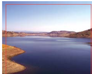
Embalse de la Fernandina

- Los Cuellos, a 7 Km. de Carboneros, aislada de la población y con 1 familia viviendo habitualmente en ella, presenta muchos de los principales atractivos naturales de Carboneros, con grandes extensiones de praderas mezcladas con arbustos y arboleda de sierra con encinas y chaparros, entre otros.