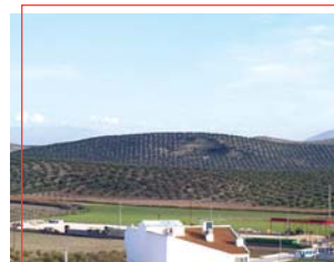
La loma Galga

Dentro de sus entornos naturales también se encuentra el Merendero Municipal , a escasos metros de la localidad, lugar de esparcimiento que dispone de áreas de sombra, bancos, etc., y al que se accede por un camino rural desde la localidad.