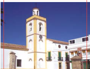
Iglesia de San Pedro Ad-Víncula