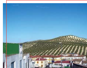
Cerro El Ejido