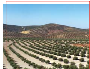
Olivos de Campiña

Pero por su interés, más histórico que natural, destaca el grupo de mesetas que configuran Las Atalayuelas, con yacimientos arqueológicos muy estudiados, que datan del II milenio a. C. y que han permitido reconstruir la historia más antigua, no sólo de este municipio, sino de la comarca de la Campiña Norte de Jaén, ya que posteriormente fue dando cobijo y defensa a sucesivas culturas hasta llegar a la romana, que demarcó su territorio a base de torres, entre ellas las de Calvete o el Espino, y reestructuró su urbanismo en la etapa romana del alto imperio llegando a ser reconocida como ciudad con Vespasiano.