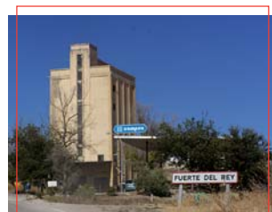
Silo de cereales