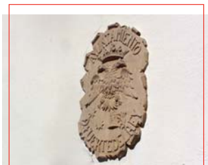
Escudo en piedra