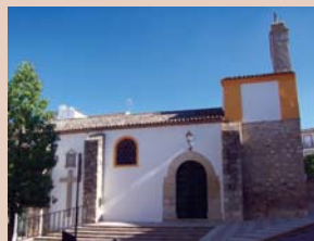
Iglesia de la Natividad

Antiguamente existió en Fuerte del Rey una fortaleza, de gran similitud con las otras frecuentes en la Campiña Norte de Jaén, que empezó a tomar forma durante los siglos del XI al XIII, cuando se construyó una fortificación entorno a una alquería situada en el actual casco urbano, y posteriormente