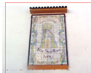
Cuadro cerámico de la patrona

El nombre de Fuente del Rey, según distintas versiones, puede deberse a la existencia en el municipio de una importante fuente de agua, propiedad del Concejo de Jaén, que era de realengo y pertenecía al Rey. Otras opiniones versan sobre su origen en la Fuente de Regomello, que aún existe en la actualidad.