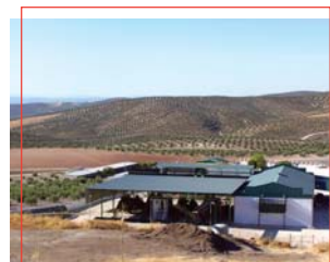
Almazara de aceite

Hornazos , típicos del Domingo de Resurrección.