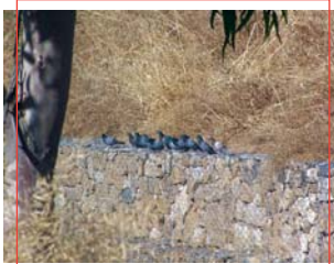
Palomas en arroyo del Pilar