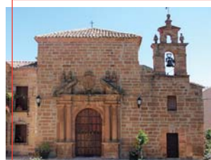
Santuario Virgen de Zocueca