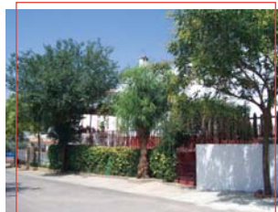
Aldea de El Altico

Especial mención merece, por las posibilidades de ocio y esparcimiento que ofrece, el Parque Acuático Aqualiva (Zocueca), el único en la provincia de Jaén.