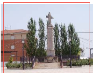
Sagrado Corazón de Jesús