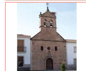
Iglesia de la Inmaculada Concepción

En la vieja Alsacia, región hoy francesa pero que en el siglo XVIII era territorio alemán, se cuenta una leyenda según la cual San Pedro, cuando iba a visitar la tumba de Jesús, se encontró con María Magdalena quien le dijo que Cristo había resucitado. San Pedro, incrédulo, contestó: "¡Ya!, creeré que eso es cierto cuando las gallinas pongan huevos de color rojo". Entonces María Magdalena abrió el delantal y le mostró una docena de huevos de un brillante color escarlata que acababa de recoger del gallinero de su casa. Esta leyenda pertenece al folclore y la cultura tradicional de algunas regiones de los colonos llegados en el siglo XVIII.