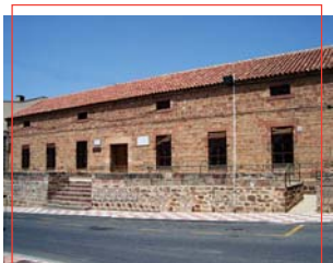
Pósito de Labradores