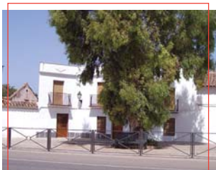
Aldea de los Ríos