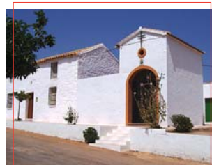
Aldea Martín Malo

Guarromán viene del árabe " Wadi-r-rumman " ("el río de los granados"), como los árabes que habitaron Sierra Morena llamaron al río que fluye junto a la venta, hoy llamado río Tamujoso.