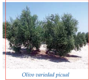
Olivo variedad picual

A raíz del hecho, y con la intención de asustar o amedrentar la voluntad de las gentes a explorar los alrededores de la población, se crea el mito «del cura sin cabeza».