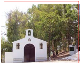
Entorno de Fuente Palacios