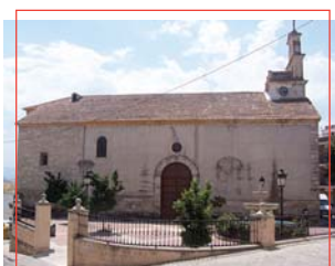
Iglesia de la Inmaculada Concepción