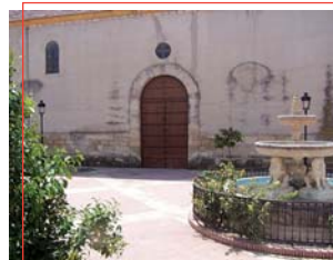
Plaza de España