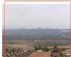
Vistas de la campiña jienense

Cada 16 de agosto, muchos/as higuereños/as, emigrantes, familias con nuevos miembros, parejas y habitantes de pueblos vecinos, acuden a la Plaza de España a « Los Pesos ». Delante de San Roque, y detrás del segundo patrón, San Sebastián, todos quieren pesarse para que la protección de los santos les acompañe allá donde vayan. El origen de esta tradición data del siglo XVII según la promesa colectiva que el pueblo de Higuera de Calatrava hizo a San Roque para que éste le librara del cólera y la peste. En ella, y en señal de agradecimiento, además de sacar en procesión al santo todos los habitantes de la villa se pesaron y donaron a la parroquia tantos kilos de trigo como arrobas pesaban. Actualmente, la donación se hace con una aportación económica y de forma simbólica.