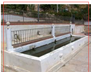
Pilar del municipio