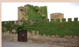
Castillo de Lopera