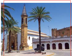
Plaza de la Constitución