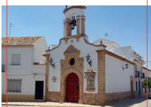
Ermita de San Roque