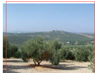
Cerro de San Cristóbal

En Lopera existen numerosos vestigios de la Guerra Civil española, donde se situó el Frente de Andújar, línea que dividía a los bandos nacional y republicano. Destaca la presencia de dos nidos de ametralladoras en buen estado así como diferentes trincheras . También se conservan, entre otros, un fortín antitanques y un refugio de la Guerra Civil, y son visibles en la torre de San Miguel del castillo los daños que ocasionó el impacto de un proyectil. En memoria de los que en combate perecieron existen distintos hitos en honor a destacados de ambos bandos. También fueron utilizados como refugios bélicos algunas cuevas repartidas por distintas zonas del núcleo poblacional.