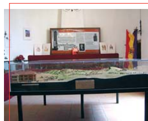
Maqueta - Museo de la Batalla

Vino blanco, fino extraído de uva Pedro Ximénez por Bodegas Herruzo, de agradable paladar que recuerda a los cercanos amontillados cordobeses, y vino dulce loperano. También se produce vino tinto a partir de la variedad Tempranillo.