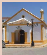
Ermita Cristo del Humilladero

En las Fiestas de Los Cristos, es el Cristo Chico el que guarda mayor tradición, debido a la Alborada del Cristo Chico . Durante la procesión esta imagen va acompañada de soldadesca por todo el recorrido con la marcha militar, disparando salvas de honor y con banderas al viento constantemente. Hay varias hipótesis sobre el origen de su cofradía: según la más extendida, unos soldados encontraron la talla pequeña del Cristo en el paraje del Humilladero, a finales del siglo XVIII, y se creó la Cofradía de la Soldadesca (1761), cuyos cofrades, llevados por su fervor disparaban salvas en honor del Cristo.