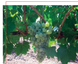
Uva Pedro Ximénez