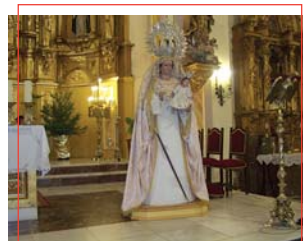
Virgen de la Paz