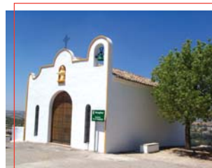
Ermita de la Magdalena

Hojuelas con miel, Pestiños de aceite, Roscos fritos y Roscos de vino.