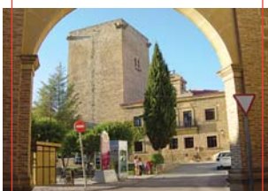
Arco Plaza de la Constitución