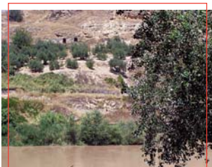
Cuevas de Palomeras