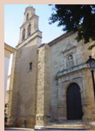
Iglesia de San Pedro

Construido por los cristianos de planta rectangular, con torreones redondos en dos esquinas, una torre cuadrada en el centro del lado este y la torre del homenaje en el centro de la plaza de armas. Ésta hoy en día es la Plaza de la Constitución , centro neurálgico de la ciudad donde se ubican Ayuntamiento, Iglesia de San Pedro Apóstol, la Casa Palacio y la Torre del Homenaje (S. XIII), esta última declarada Monumento Histórico en 1985, lo único que queda del castillo, construida con sillarejo y esquinas reforzadas a soga y tizón, y saeteras en los muros, con tres pisos.