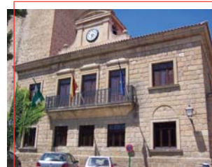
Fachada del Ayuntamiento

La ciudad de Iliturgi, de intensa vida municipal y donde se han documentado un pequeño templo y una plaza pública o foro municipal, entre otros, y que fuera destruida por Publio Cornelio Scipión por el 206 a. C. y reconstruido ya en el siglo II a. C. según el estatuto privilegiado Iliturgi Forum Iulium , se ubica con toda probabilidad en el cerro Máquiz de Mengíbar. Citada por primera vez por Tito Livio y protagonista en la Segunda Guerra Púnica, se ha identificado en dicho asentamiento con un modelo territorial romano confirmado por otros aparecidos en sus alrededores.