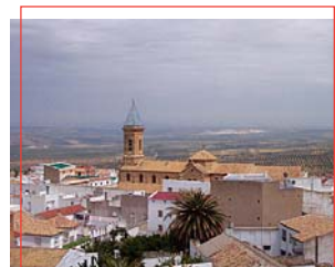
Panorámica de Porcuna