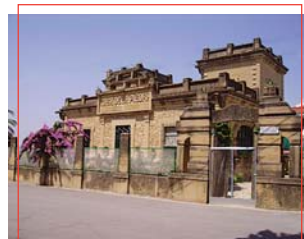
Casa de Piedra

Torico de Reyes o de azúcar: dulce de masa con forma de toros, jacas, palomas, lagartos..., que se elabora como regalo para los niños en la Epifanía del Señor.