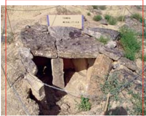
Tumba Megalítica - Cerrillo Blanco