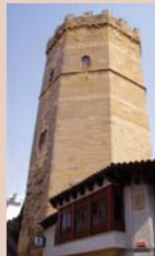
Torre de Boabdil

Asentada sobre el primitivo establecimiento romano, constaba de trece torres y una central, protegida por almenadas y saeteras. Actualmente destaca la Torre de Boabdil (S.