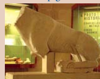
Leona ibérica - Museo de Obulco

En el cerro de la Calderona, en el barrio de San Benito y en La Peñuela se identifican los restos de esta antigua gran ciudad ibero-romana. Entre las edificaciones excavadas destaca la «Casa de las Columnas», patio rodeado por enormes columnas de un solo bloque de piedra y enormes capiteles. En el suelo de otras viviendas se observa un pavimento doméstico con ladrillos de canto en forma de espiga.