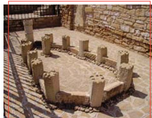
Maqueta en piedra de la fortaleza