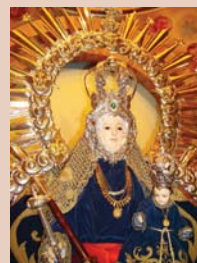
Virgen de Alharilla

El segundo domingo de mayo tiene lugar esta romería, celebrada en honor de la patrona de Porcuna desde hace más de siete siglos. Se inicia el sábado con el desfile de la Cofradía en caballos y carrozas camino de los Llanos del Santuario, donde se desarrolla la jornada festiva hasta unirse a la procesión de la imagen mariana hasta el paraje cercano del Humilladero. Según la tradición, la Virgen se apareció en la aldea árabe de Alhara, a unos 4 Km. de Porcuna, edificándose allí una ermita y celebrándose una afamada romería, originariamente el 25 de marzo.