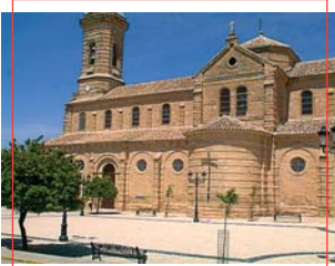
Iglesia de la Asunción

XV), Monumento Nacional desde 1982, es una torre-vivienda medieval de 28 m. de altura sobre planta octogonal, con dos estancias superpuestas en el interior con bóvedas góticas, construida por la Orden de Calatrava entre 1411 y 1435, y situada en uno de los extremos de la fortaleza; en ella estuvo varios meses preso, hacia 1485, el rey de Granada Boabdil "El Chico", aprisionado en la batalla de Lucena. En su interior alberga parte del Museo Arqueológico Municipal de Obulco, que se completa con la Sala expuesta en el Ayuntamiento y los propios yacimientos de Porcuna.