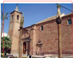
Iglesia de la Natividad