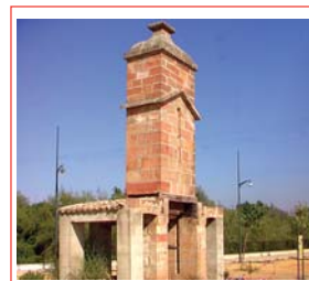
Prensa de Torre

Ayuntamiento de Villanueva de la Reina Plaza de Andalucía, 1 C.P.: 23730 Tif.: 953 53 70 86 - Fax: 953 53 75 02 vreina@promojaen.es www.vreina.com