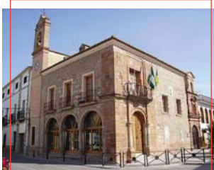
Edificio del Ayuntamiento