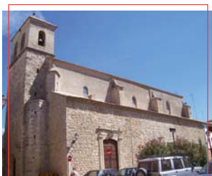
Iglesia de Santa María