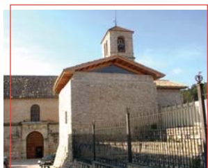
Restos del Castillo

Ayuntamiento de Torredonjimeno Plaza de la Constitución, 1 C.P.: 23650 Tif.: 953 57 19 50 Fax: 953 34 13 26 www.tosiria.com