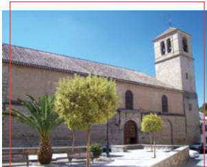
Iglesia San Pedro