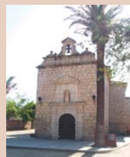
Ermita de Consolación

Según la tradición popular, la Virgen de Consolación apareció en 1458 en la Cueva de la Virgen, donde más de tres siglos antes había sido escondida para evitar que llegara a manos de los infieles. A su intercesión se atribuyó la victoria cristiana frente tropas musulmanas en una crucial batalla acontecida pocos años después de ser encontrada, en 1471. En su honor Diego López Pacheco, marqués de Villena, hizo ampliar su ermita y construir una capilla de estilo gótico en su interior.