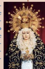
Virgen de los Dolores

Declarada de Interés Turístico Nacional de Andalucía en 2006. La mayoría de cofradías inician su estación de penitencia en la iglesia de San Pedro y realizan el mismo recorrido según un orden cronológico que proviene de mediados del siglo XVI. Destacan las "corrias" de la Virgen de los Dolores en la tarde del Viernes de Dolores y en la noche del Viernes Santo: éstas consisten en correr con el paso sobre los hombros en determinados puntos del recorrido. Las "manos" o las "palmas" son otros movimientos que realizan los anderos, llevando el paso a ras de suelo o por encima de la cabeza, respectivamente.