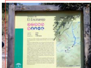
Indicación inicio de sendero