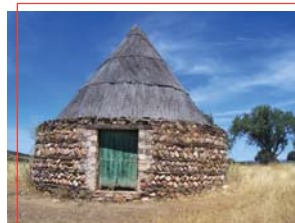
Chozo de trashumantes

Breve descripción: Por una vereda en constante ascenso entre vegetación autóctona, se llega a San Ginés. Desde aquí, llegaremos al Lugar Nuevo para realizar el ascenso final al Santuario.