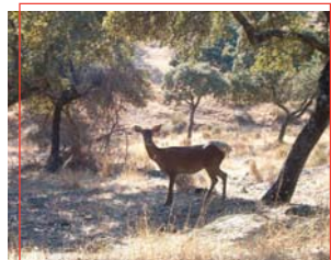
Cierva de Sierra Morena

Para los amantes de la fotografía ecológica, estos parajes son ideales, tranquilos, poco conocidos, de gran belleza y armonía. Las grandes superficies de terreno, con prados con arbolado muy abierto o dehesas, ofrecen un marco incomparable a las numerosas y renombradas ganaderías de reses bravas . Igualmente los aficionados a los deportes de aire libre, senderismo, mountain-bike, rutas a caballo, escalada, etc., encuentran aquí un lugar idóneo. La actividad de la caza se puede compaginar, en los embalses de La Lancha, el Encinarejo, el Rumblar y el Yeguas, con la práctica de la pesca o con deportes acuáticos de bajo impacto medioambiental.