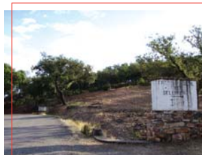
Acceso a Selladores