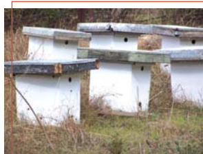
Colmenas de abejas