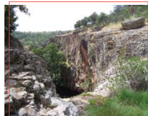
Estratos de cuarcita armoricana