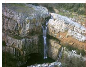
Salto de la Cimbarra

Breve Descripción: Hay que seguir un estrecho sendero por el que se debe transitar con cuidado dada la cercanía de numerosos cortados rocosos, hasta llegar a la Plaza de Armas. Continúa bordeando el monte, entre vegetación cerrada, por una senda que conduce al inicio del recorrido.